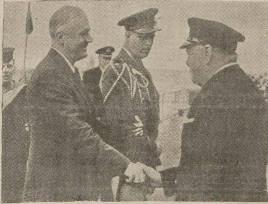
Ruzvelt ve Çörçil bundan evvelki mülakatları esnasında

Ankara 18 (A.A.) — Büyük Millet Meclisi bugün Refet Canitekin reisiliğinde toplanmıştır.