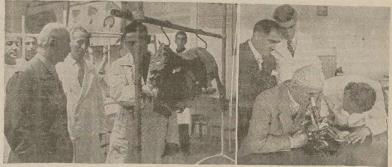
Millî Şef Yüksek Ziraat Enstitüsü imtihanlarında Sağda teşrif imtihanında, solda sağıın Hastahklar imtihanında

Reisicümhur imtihanları büyük bir alâka ile takib buyurdular ve talebelere sualler sordular