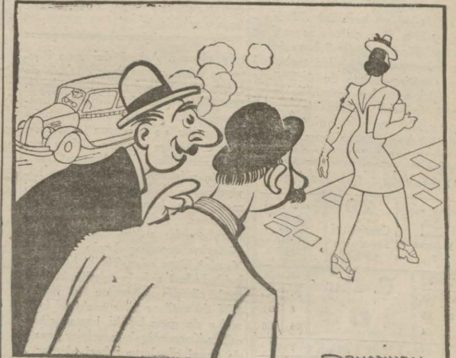
Şoförlerin son zam talepleri münasebetile — Ne biçim kadın, hergün yeni bir şey istiyor! — Şoför mü?

Köylerdeki bütün nakil vasıtaları, köy taşıt birliğini teşkil edeceklerdir. Köy taşıt birliğinden azami mutad pazar yeri ile köy arasındaki kısa mesafeli nakliyat için istifade olunacaktır. Kazalarda motörsüz nakil vasıtalarından beşer tonluk taşıt kolları ellişer tona kadar taşıt grupları, vilâyetlerde de yüzer tona kadar taşıt vasıtaları (Devamı 5 inci sayfada)