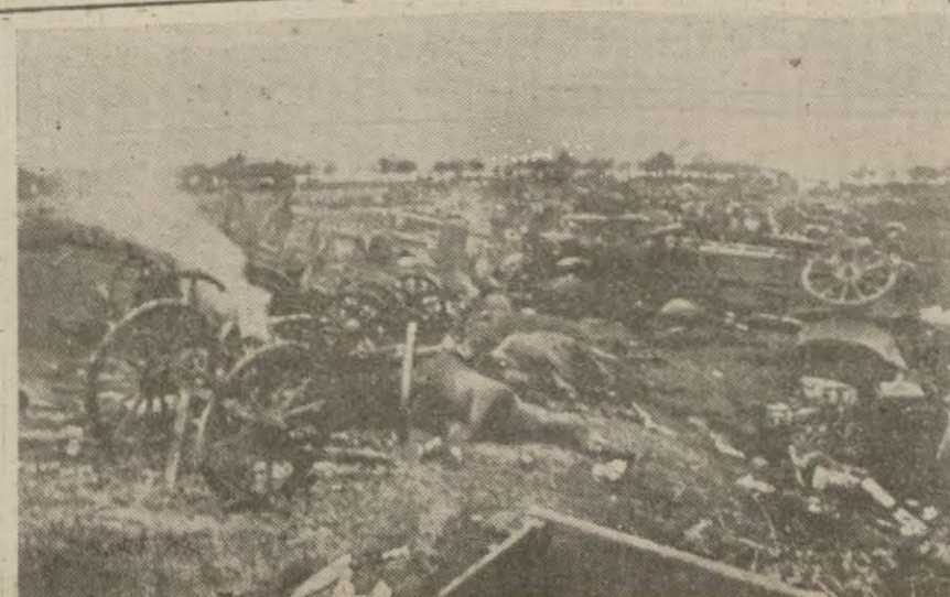
Harkofun cümlede bir muharebe sahnesinin hali

Birleşik Amerikanın Pasifik Okyanusundaki deniz ve hava filolarının son günlerde ehemmiyetli bir surette takviye edilmiş olduğu ve bu filoların Pasifğin artık hemen her sahasında Japon saldırılarına kuvvetle mukabele edebilecek bir halle geldiği anlaşılmaktadır. Son zamanlarda, birisinde Yeni Gine adasının cümle kısımlarını, diğerinde de Midvay adasını ve belki de